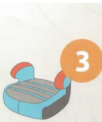
22-36 кг от 6 до 12 лет