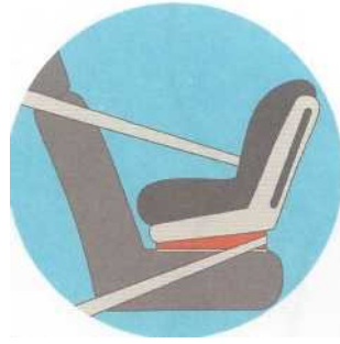
Лицом против движения