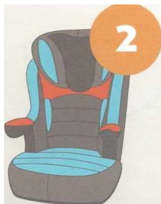
15-25 кг от 3 до 7 лет